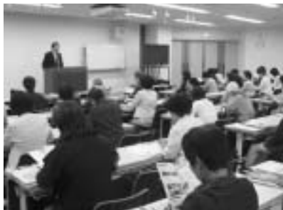
滋賀県商工会議所女性性会連台会先進地視察研修会

当会で7名が参加。毎年県下7女性の持ち回りで会場を回しているが、今回は大津の女性会さんが担当。龍谷大学の産学連携事業や、市民への生涯学習事業を実施している施設を訪問し説明していただいた。その後、今年は、紫式部が源氏物語を書きはじめ、千年を迎えることから石山寺を中心にイベントを開催されている「源氏物語千年紀in湖都大津」を訪れて現地ボランティアガイドの説明を聞きながら散策を行った。