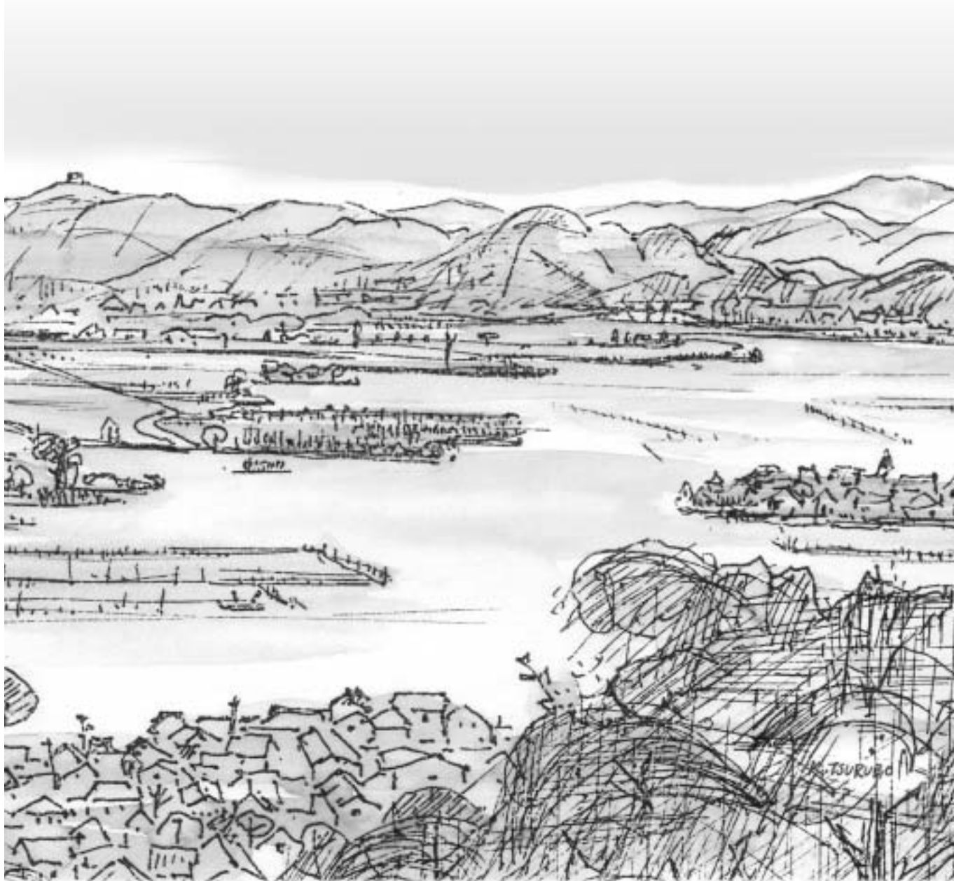
安土山より西の湖を望む