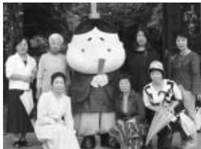
源氏物語千年紀in湖都大津