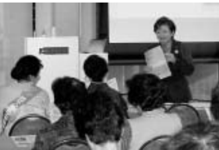
滋賀県知事講演会