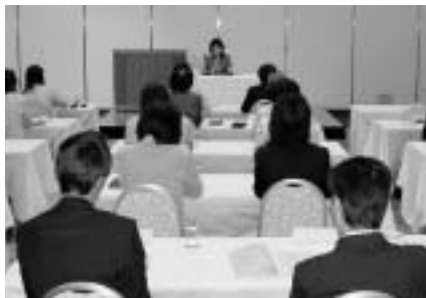
県商女性連定時総会

草津エストピアホテルにて正副会長出席。県下7女性の正副会長による理事総会。全ての議案事項が満場一致で可決承認された。総会後の講演会では、「ドメスティックバイオレンス（DV）」と女性の社会進出についてを学び、最近問題になっているDVについては、滋賀県の現状についてお話を聞ける機会となった。