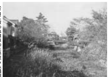
へ下口に被われ雑草の生い茂る八幡堀

へ下口に被われ埋め立てが計画されていた八幡堀 が市民の力で再生して約30年。今や、近江八幡の観 光の中心地となりました。この堀を舞台に「八幡堀 まつり」や、久しく開催された「町並みと戯れる花 展」など、様々なイベントが市民の力で開催され、 益々華やかでにぎやかな風景をつくり出しています。 市民の散策する姿も見 られ、癒いの場となっ ています。