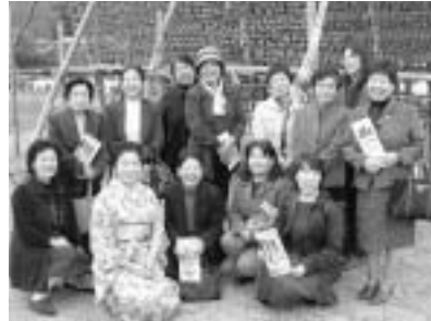
米原市商工会商工会女性部との交流会

平成19年4月に4町（伊吹・山東・近江・米原）が合併されて、それぞれの特産品を活かして、開発研究されて地域活性化に取り組みをされて新しく編成された米原市商工会女性部と、交流研修会をおこない当会では7名が出席。