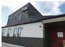
焼肉 すき焼き 池もと 「安土の地でおいしい近江牛をご堪能ください。」 安土町桑実寺 488-1