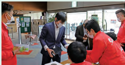
記念ゴルフコンペ

令和4年4月18日(月)近江カントリー倶楽部において、73名が参加し、記念ゴルフコンペを開催しました。天候にもめぐまれ、記念式典につながる事業となりました。集まった寄付金は、青経会創立の年に発生した東日本大震災を機に、復興支援を通じて交流を深めてきた気仙沼商工会議所青年部へ寄付しました。