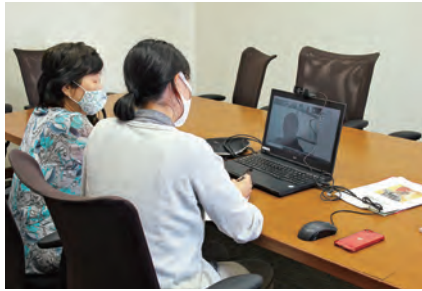
女性会・はちまん青年経営者会では、Zoomを活用してオンライン会議を行っています!

新型コロナウイルス感染症の感染拡大の影響により、大人数での会議や寄合の開催が難しくなり、地域の活動されている事業者さま・団体さまに影響が出ています。