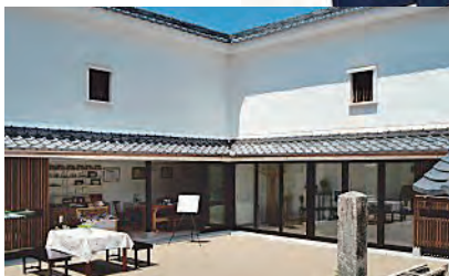
cafe & shop SHINMACHI 近江八幡市新町2丁目22 近江八幡市立資料館内

近江八幡市出町487-1 TEL 0748-33-2914 FAX 0748-32-3514 営業時間 9:30 ~ 18:30 定休日 毎週土日